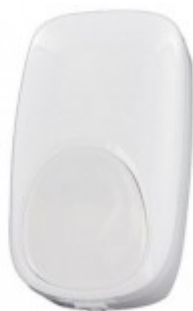
* Top View

DT8016AF4 to czujka ruchu PIR+MW o optyce lustrzanej z antymaskingiem. Urządzenie łączy skuteczność detekcji z odpornością na fałszywe alarmy oraz nowoczesnym wyglądem. Czujka wyposażona jest w szereg funkcjonalności ułatwiających pracę instalatora. Zgodność z GRADE3.