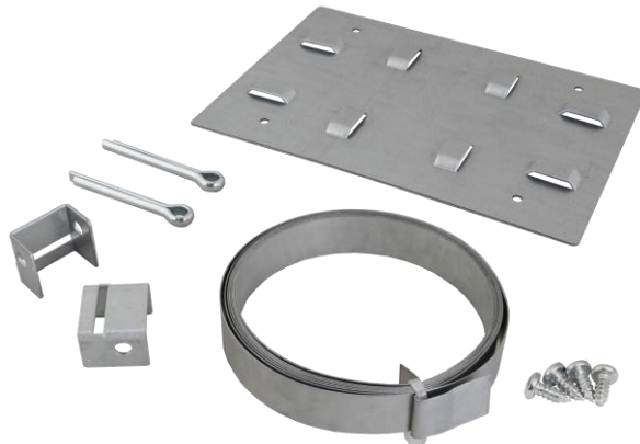
Rys. 1 Widok zawartości zestawu

Wydanie: 1 z dnia 30.01.201 Zastępuje wydanie: -----