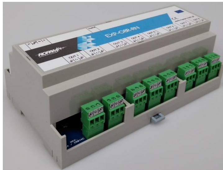
1 EXP-O8R-RN-D9M widok od strony złącz przekaźników