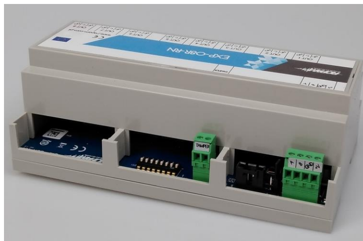
2 EXP-O8R-RN-D9M widok od strony złącz zasilania i komunikacji