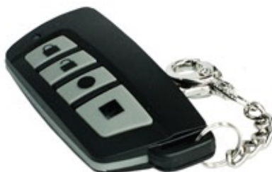
TR-4H – pilot do RF-4